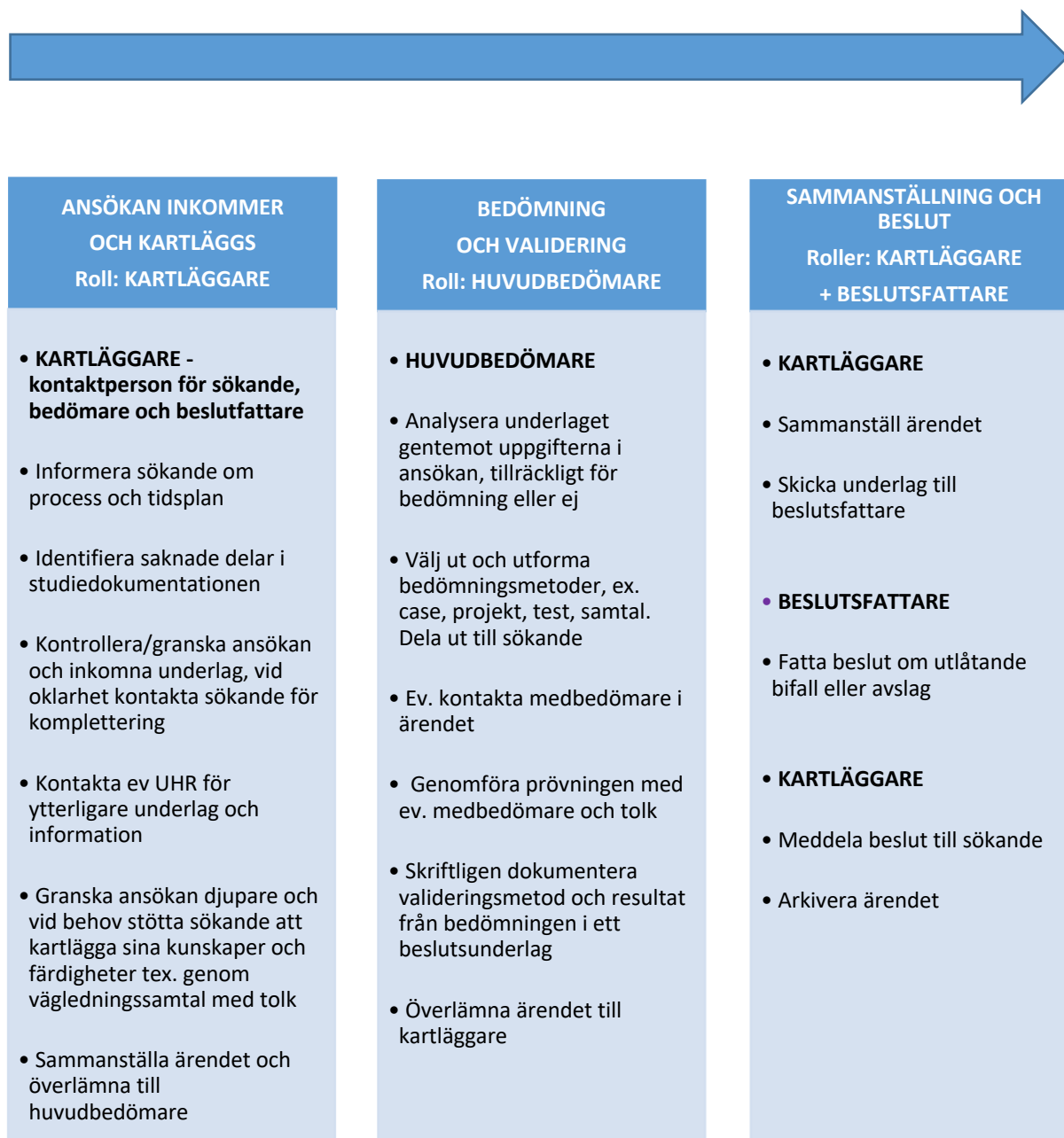
Bild 3. Översiktlig processbild och checklista över lärosätets validering för erkännande av utländsk utbildning