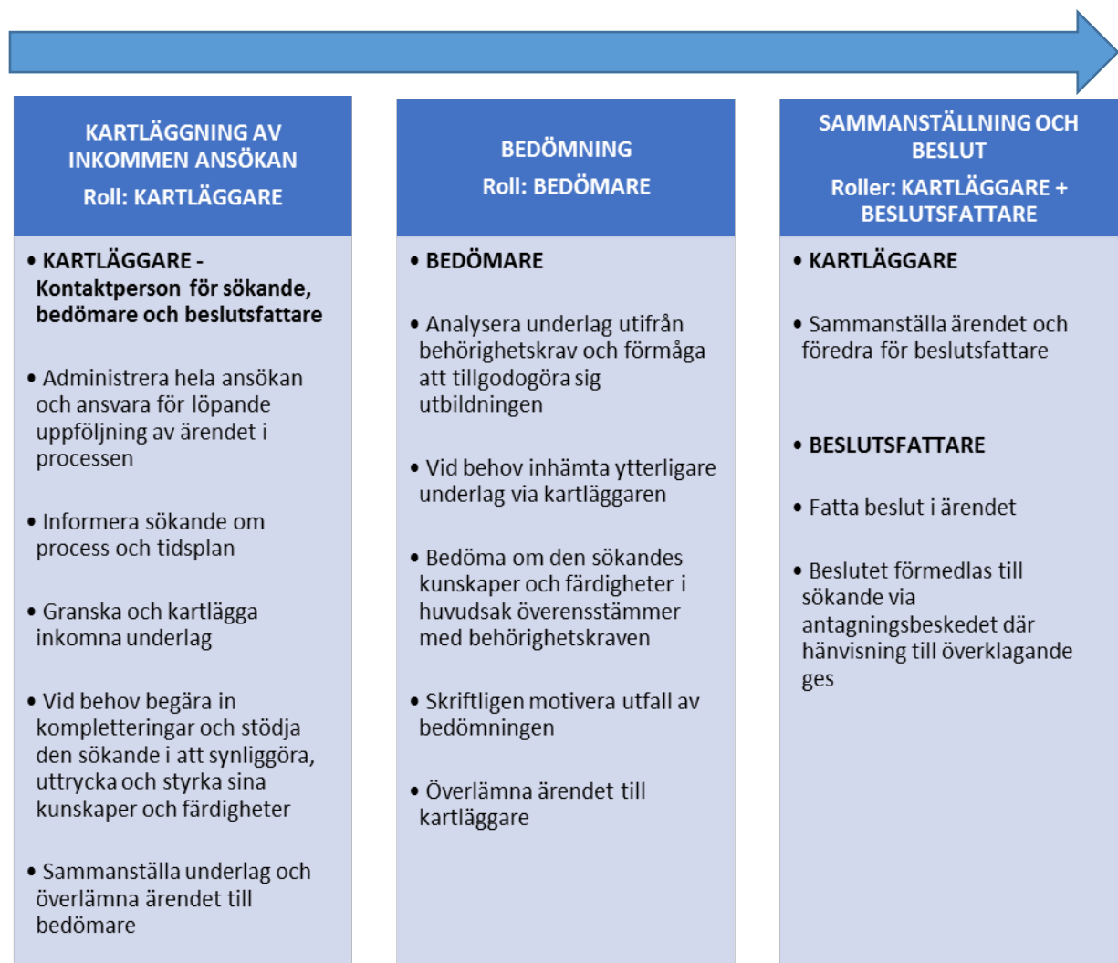
Bild 1. Översiktlig processbild och checklista över lärosätets bedömning av reell kompetens för behörighet